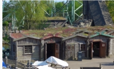
Begrünte Dächer Nachhaltigkeit, Seite 30