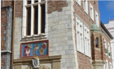
Rund 40 Nachbauten Hanse in Europa, Seite 21