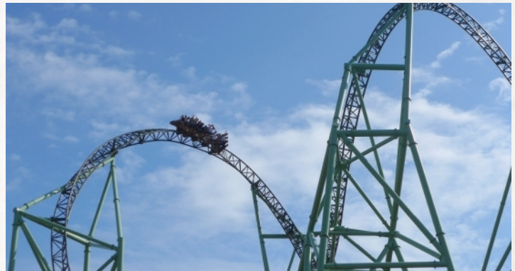
Die höchste Achterbahn Deutschlands und größte Investition Der Schwur des Kärnan, Seite 11