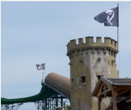
Störtebekers Kaper(n)fahrt Verwechslungen, Seite 43